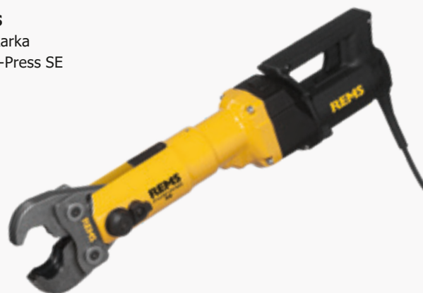
REMS Zaciskarka Power-Press SE