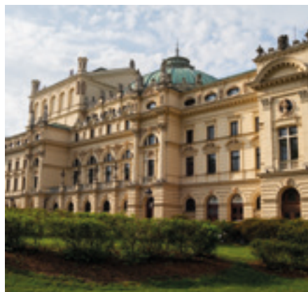
Teatr im. Juliusza Słowackiego Kraków, Polska