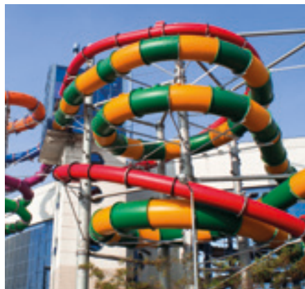
Park Wodny Kraków, Polska