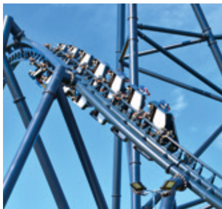
Park Rozrywki Energylandia Zator, Polska