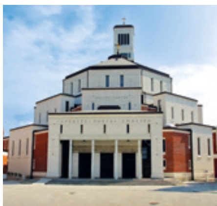
Centrum Jana Pawła II Kraków, Polska