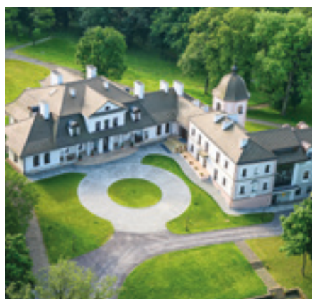
Dwór Kombornia Kambornia, Polska