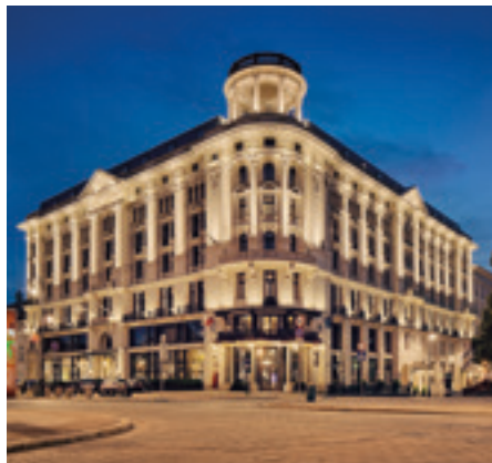
Hotel Bristol Warszawa, Polska