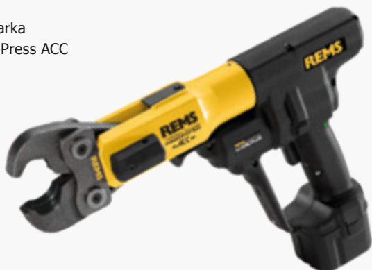
REMS Zaciskarka Power-Press ACC