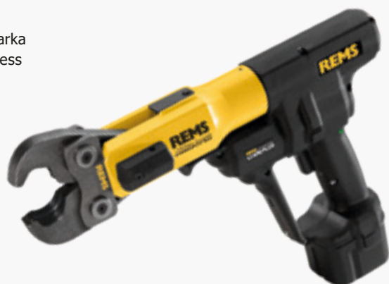
REMS Zaciskarka Aku-Press